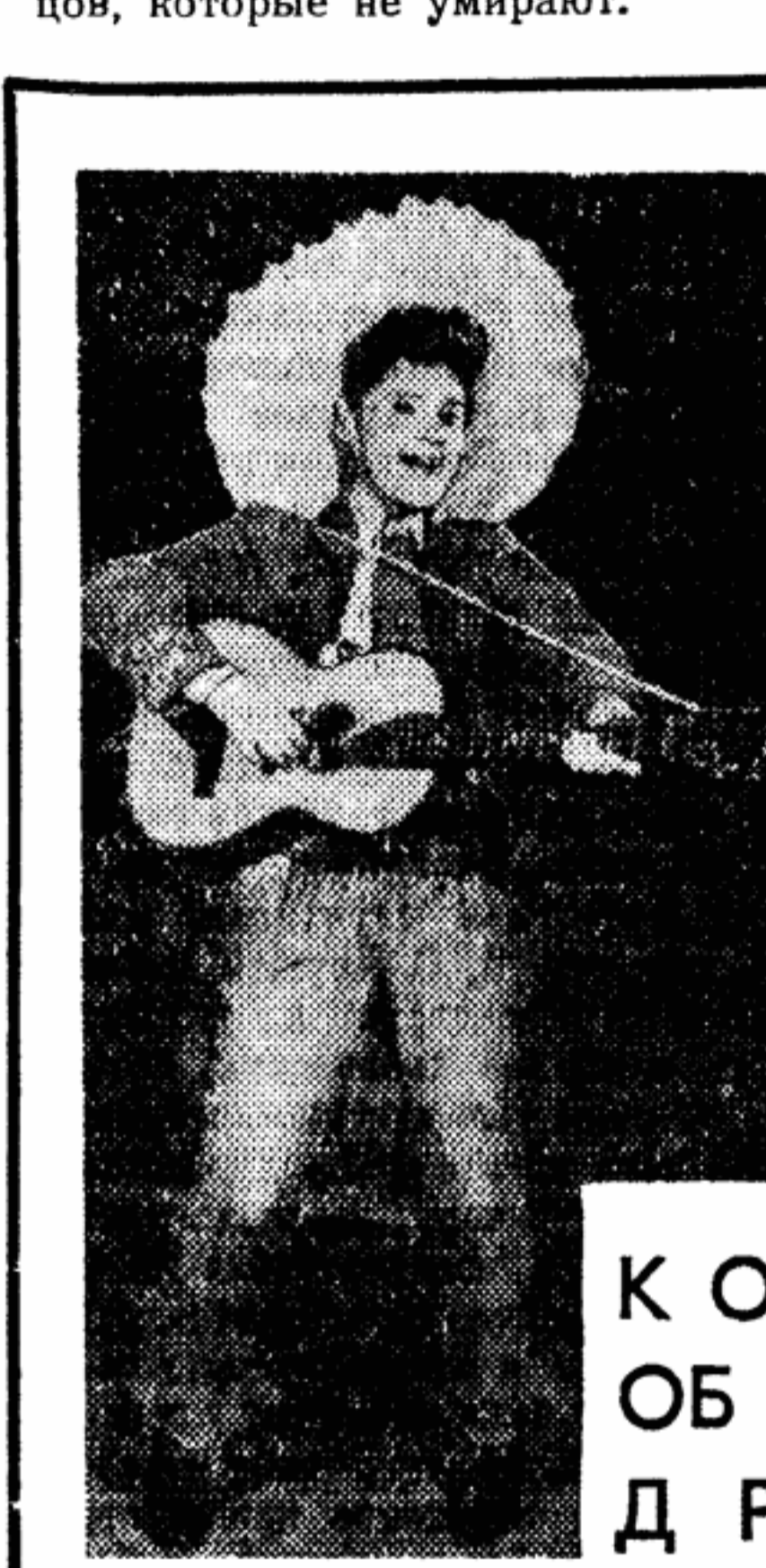
Наш театр скачет по веселой комедии. Не так уж часто драматурги дарят зрителя улыбку, остроумием и тем неподдельным весельем, которое свойственно юности нашему народу.